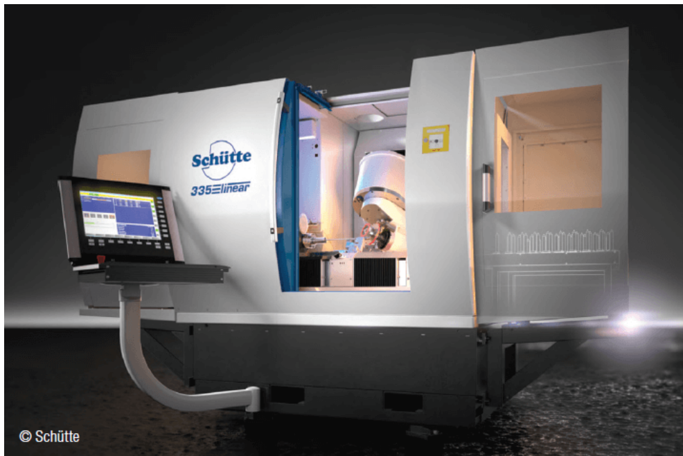
Slibemaskine i 335linear-serien fra Schütte.