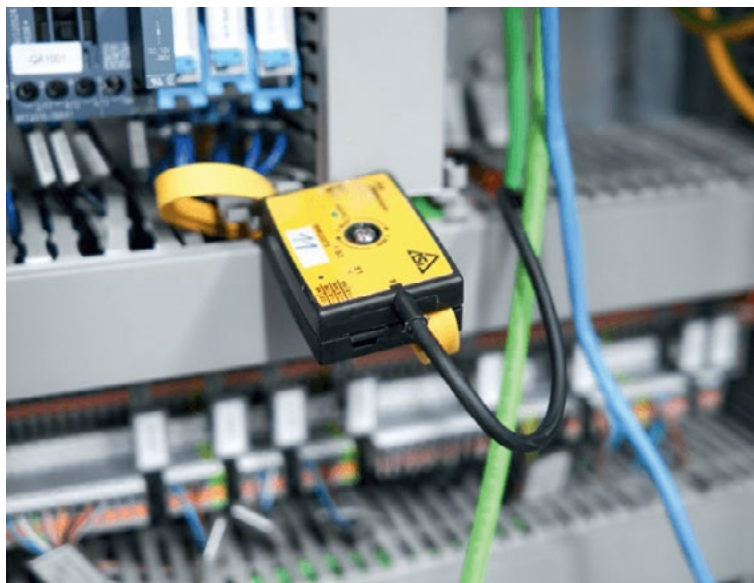
Aktiv distributør ASI Safety BWU3373 fra Bihl+Wiedemann til integration af sikkerhedsafbrydere i ASI-netværket.

Kompakt, enkel, hög kvalitet, flexibel (användningsbar), ekonomisk och framtidssäker – attribut som på ett träffande sätt beskriver både slipmaskinerna från Schütte och AS-Interface-lösningarna från Bihl+Wiedemann. Det är därför ingen större överraskning att samarbetet mellan de två företagen genom åren har blivit en framgångssaga – och att det kommer att fortsätta.