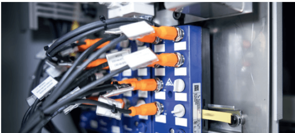
ASi 4E/4A-moduler fra Bihl+Wiedemann

Och slutligen är en lösning med AS-Interface inte bara oslagbar för Schütte när det gäller teknik, utan också av kostnads- och effektivitetsskäl. Enligt C. Langen ser företaget regelbundet över om det skulle vara meningsfullt att byta till ett fältbussystem. Det har dock under många år stått klart att användningen av PROFINET- eller EtherCAT-komponenter i kringutrustningen inte bara skulle bli betydligt dyrare, utan också skulle göra produktionen mycket mer komplicerad eftersom maskinhusen inte längre skulle kunna tillverkas oberoende av det beskrivna styrsystemet.