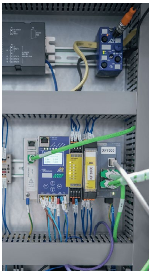
Til brugen af procesdata kan IO-Link-sensorer nemt integreres i eksisterende ASI-netværk via ASI-5-moduler med integrerede IO-Link-mastere (ovenfor) og ASI-5/ASI-3 Safety-gateways (nedenfor) fra Bihl+Wiedemann

Kompakt, enkel, hög kvalitet, flexibel (användningsbar), ekonomisk och framtidssäker – attribut som på ett träffande sätt beskriver både slipmaskinerna från Schütte och AS-Interface-lösningarna från Bihl+Wiedemann. Det är därför ingen större överraskning att samarbetet mellan de två företagen genom åren har blivit en framgångssaga – och att det kommer att fortsätta.