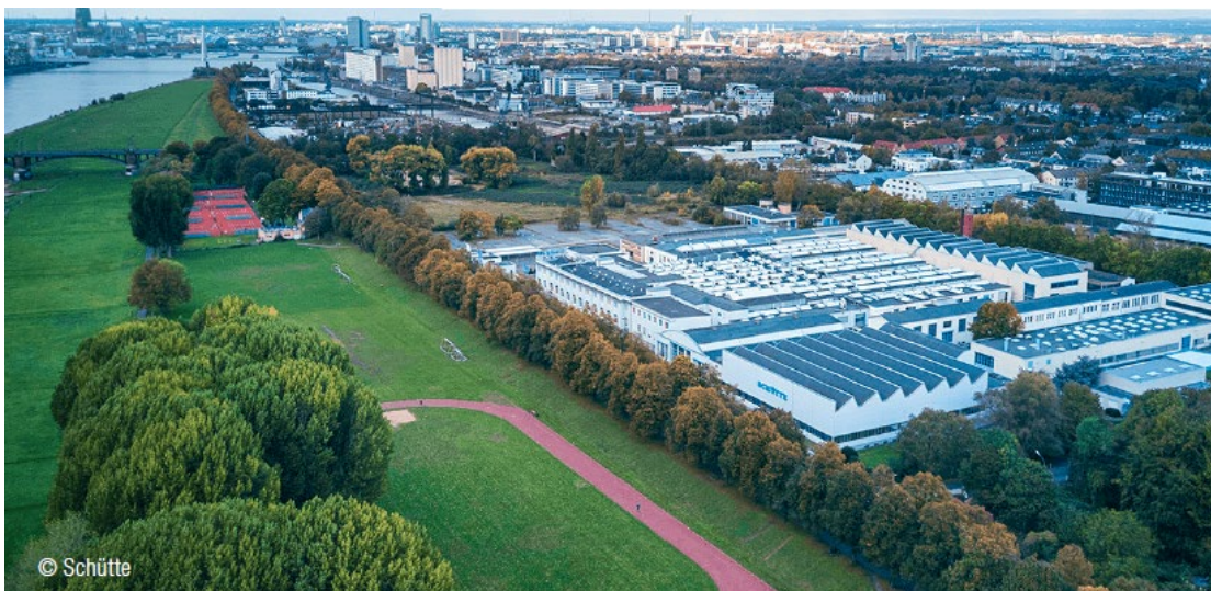
Alfred H. Schütte GmbH & Co. KG er en tysk producent af værktøjsmaskiner med base i Köln.

Båda serierna är tillgängliga med ett brett utbud automationsalternativ för kontinuerlig anpassning och utbyggnad – till exempel inom området för verktygs- och arbetsstyckeshantering för obemannad drift. Detta gör det möjligt för användarna att reagera flexibelt på förändrade produktionskrav – och detta under maskinens hela livslängd. Schütte gör det möjligt att använda två olika styrsystem hos sina slipmaskiner: SIEMENS SINUMERIK ONE och NUM Flexium+. SINUMERIK ONE använder PROFIsafe via PROFINET för kommunikation och används tillsammans med drift- och programmeringsgränssnittet SIGSpro (Schütte Integrated Grinding Software), medan NUM Flexium+ förlitar sig på EtherCAT och arbetar med NUMROTO.