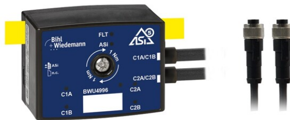
Afb.: Bij de nieuwe ASi-5-telmodule (BWU4996) met klasse IP67 worden de ingangen en sensoren vanuit ASi gevoed en de periferie via twee M12-kabelaansluitingen (5-polig).

De beproefde ASi-5-technologie van onze telmodules is voortaan ook toepasbaar in de kabelgoot respectievelijk een nieuwe vorm van behuizing in combinatie met de compacte ASi-5-telmodule BWU4996 . Voorheen hadden alle ASi-5-meetmodules altijd vier tweekanaals-metingen. De BWU4996 vormt een uitbreiding op het productportfolio met zijn twee tweekanaals-metingen. Hiermee zijn voortaan ook kleine toepassingen nog flexibeler en voordeliger te realiseren. Daar komt bij dat gebruikte metingen als digitale ingangen te configureren zijn.