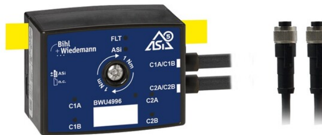
Fig.: Med det nye ASi-5-tællermodul ( BWU4996 ) i IP67 forsynes indgangene og sensorerne fra ASi samt periferenhederne via 2x M12-kabelstik (5-polet).

Nu kan du også anvende den gennemprøvede ASi-5-teknologi fra vores tællermoduler i en kabelkanal og i et nyt husdesign – takket være det kompakte ASi-5 tællermodul BWU4996 . Tidligere tilbød alle ASi-5-tællermoduler altid fire 2-kanals tællerindgange. BWU4996 udvider nu produktporteføljen med to 2-kanals tællerindgange. Det giver dig mulighed for at løse små opgaver endnu mere fleksibelt og omkostningseffektivt. Ubrugte tællerindgange kan desuden konfigureres som digitale indgange.