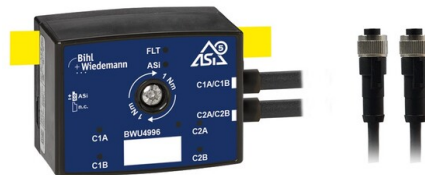
Abb.: Beim neuen ASi-5 Zählermodul ( BWU4996 ) in IP67 werden die Eingänge und Sensoren aus ASi sowie die Peripherie über 2x M12-Kabelbuchsen (5-polig) versorgt.

Nutzen Sie die bewährte ASi-5 Technologie unserer Zählermodule jetzt auch im Kabelkanal bzw. in neuer Gehäuseform – mit dem kompakten ASi-5 Zählermodul BWU4996 . Bisher boten alle ASi-5 Zählermodule immer vier 2-kanalige Zählereingänge. Der BWU4996 erweitert das Produktportfolio jetzt mit zwei 2-kanaligen Zählereingängen . Somit können Sie kleine Applikationen noch flexibler und kostengünstiger lösen. Zudem lassen sich unbenutzte Zählereingänge als digitale Eingänge konfigurieren.